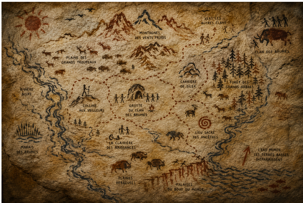
Le territoire du Clan des Brumes